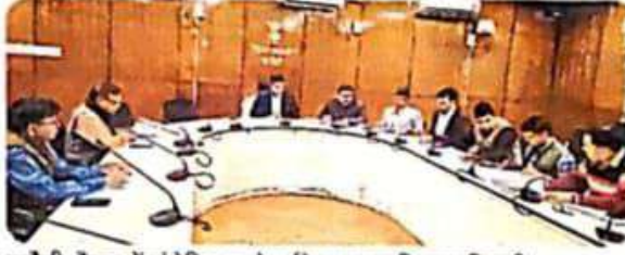
करौली. बैठक में संबोधित करते पर्यवेक्षक व उपस्थित अधिकारी।

उन्होंने विशेष गहन पुनरीक्षण कार्यक्रम 2026 से संबंधित गतिविधियों, कार्मिकों की नियुक्ति, दूरदराज के इलाकों में नेटवर्क की उपलब्धता, नोटिसों का च्योरा, एसआइआर संक्षिप्त रिपोर्ट, दावा-आपत्ति निस्तारण की वस्तुस्थिति, फार्म 7 एवं फार्म 6 के निस्तारण की स्थिति का जायजा लिया। इस दौरान उन्होंने कहा कि निर्वाचन अधिकारी निर्वाचन सूची एवं हटाए जाने वाले नामों की शुचिता सुनिश्चित करें। किसी का भी नाम बिना दावा-आपत्ति एवं समुचित सुनवाई का अवसर दिए बिना नहीं हटाया जाए। वहीं कोई भी