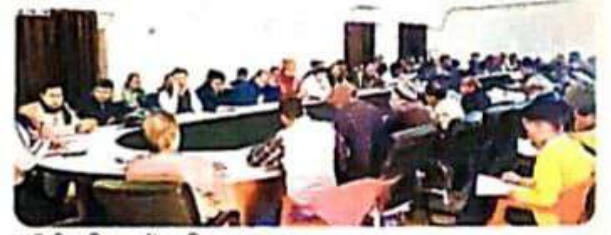
करौली. प्रशिक्षण में उपस्थित प्रणक।